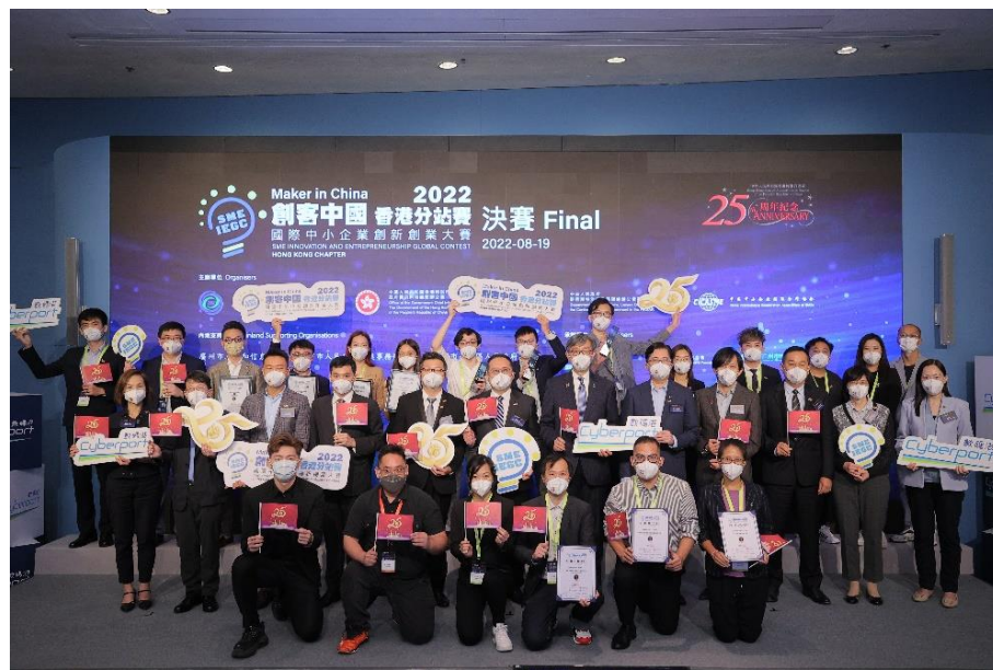
「创客中国」国际中小企业创新创业大赛香港分站赛决赛今天顺利举行，参赛队伍逾150队，再创纪录。