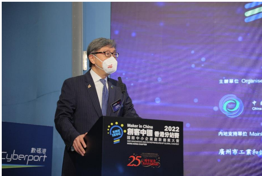
数码港行政总裁任景信鼓励胜出队伍善用赛事所提供进军大湾区市场的支持，尤其是国家政策及内地创科园区的支持，对接内地市场及投资者。