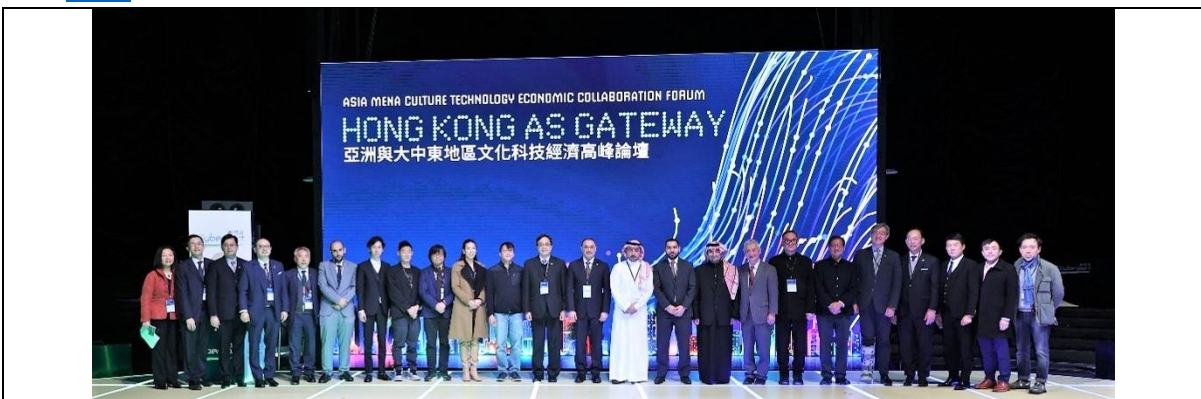
本港文化創意產業與數碼娛樂業界代表與沙特阿拉伯代表團，探討香港如何作為促進亞洲及大中東地區 ( MENA ) 交流的門戶