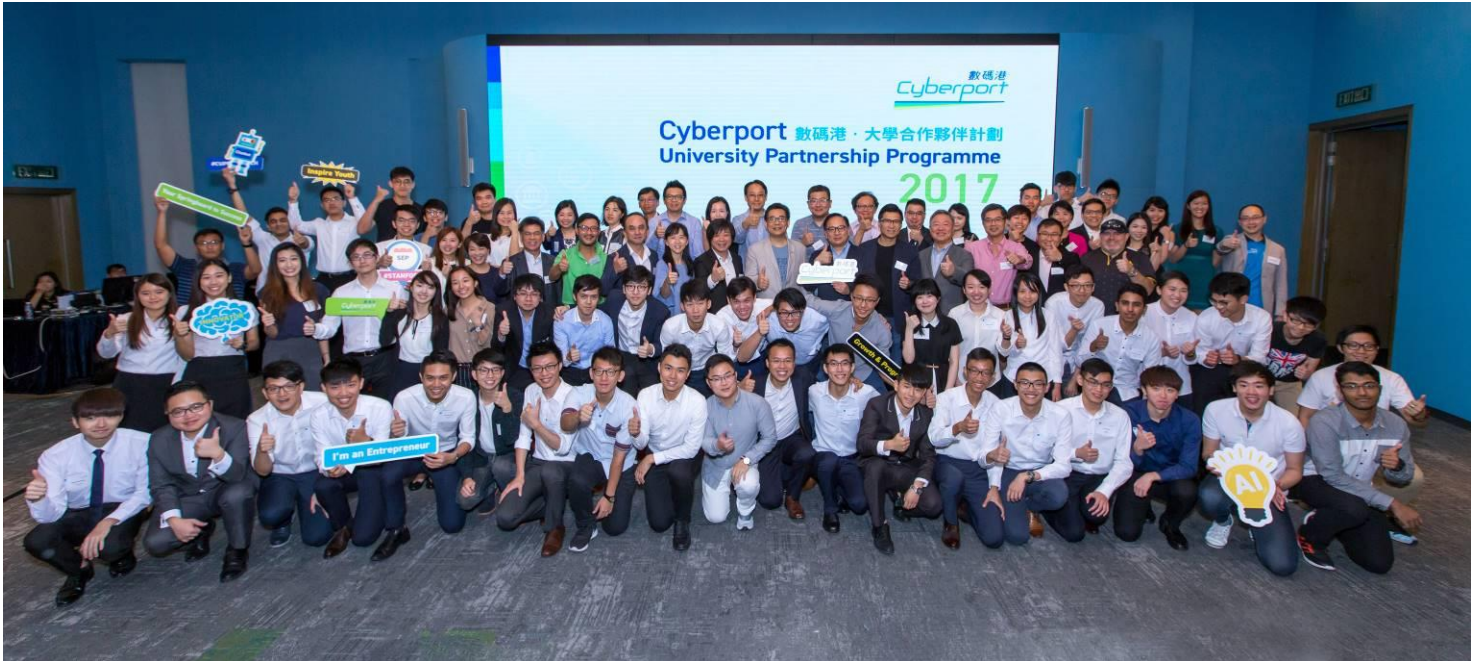
[圖四]「數碼港·大學合作夥伴計劃 2017」共有 21 支來自六間本地大學的代表隊伍參與，他們將參與一連串創業培訓，與業界菁英交流學習，並於九月下旬赴美參與度身訂造的創業營，學習金融科技創業之道。