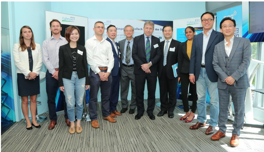
[圖五] 數碼港金融科技公司 Taiger、TNG 電子錢包、APrivity 和 Privé Managers 為在場人士展示其創新金融科技解決方案。隨著 FinTech Nucleus 的進駐，數碼港環球金融科技中心 (Centre of Global FinTech Innovation) 將會展示更多出色的創新金融科技創新解決方案。