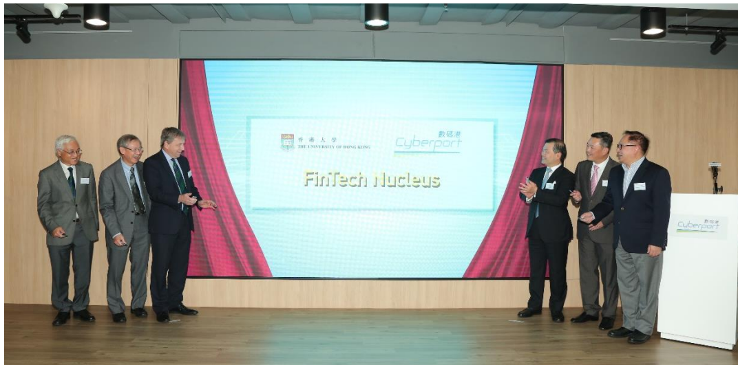
[圖二] 「港大 x 數碼港 FinTech Nucleus」揭幕儀式，隨著 FinTech Nucleus 的進駐，數碼港環球金融科技中心將會展示更多出色的創新金融科技解決方案。(左起) 香港大學首席副校長譚廣亨教授; 香港大學副校長(研究)賀子森教授; 香港大學校長馬斐森教授; 數碼港董事局主席林家禮博士; 數碼港行政總裁林向陽先生; 數碼港公眾使命總監湛家揚博士。