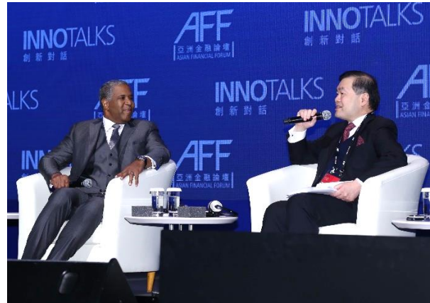
(左) Vista Equity Partners 创始人、主席兼首席执行官史维飞先生