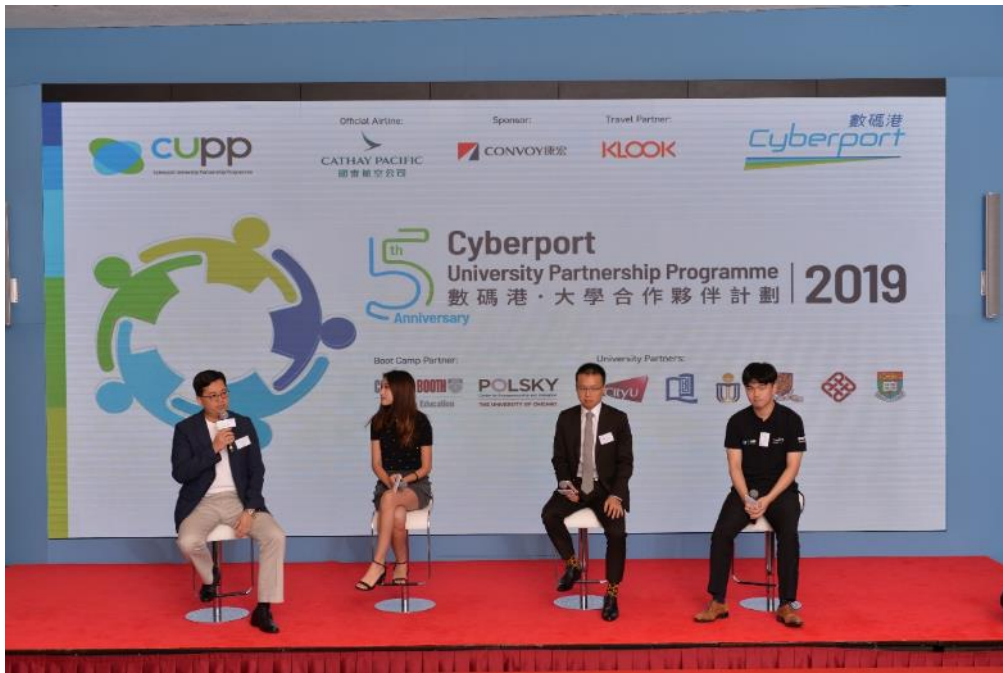
「数码港·大学合作伙伴计划」毕业生于启动礼上，跟新一届学员分享经验。