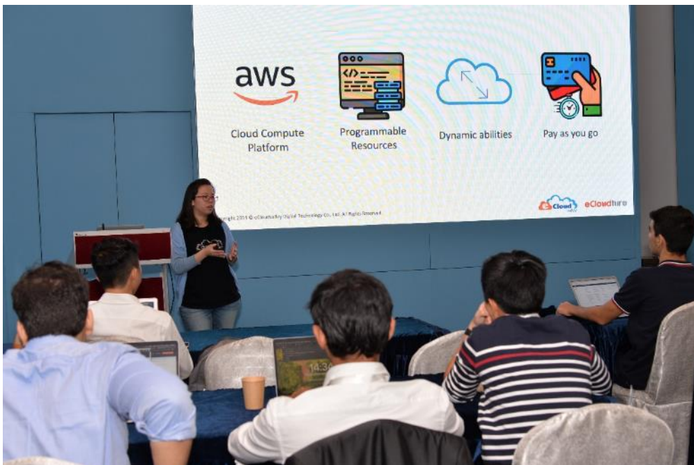
首场培训于启动礼后随即进行，由 Amazon Web Services (AWS)及伊云谷向参与学生讲授云端技术在金融科技的应用。