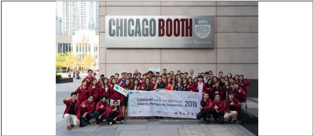
[图六]: 学生于 8 月远赴美国芝加哥大学布斯商学院参与创业营，接受为期一周的金融科技与商业方案设计培训。