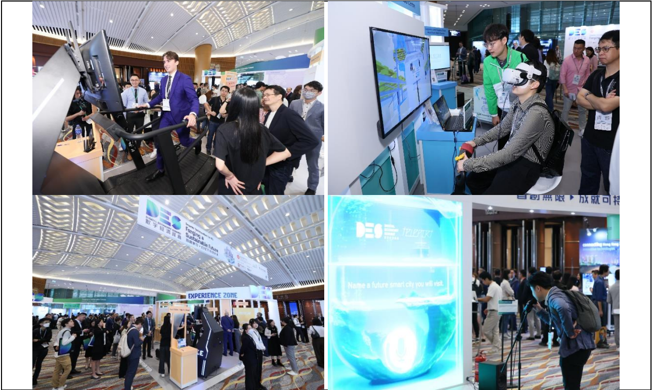
会场设有互动体验区，让与会者亲身体验各个范畴，包括智能教室、生活与健康、绿色生活、新型工业化，以及第三代互联网的智慧城市解决方案。