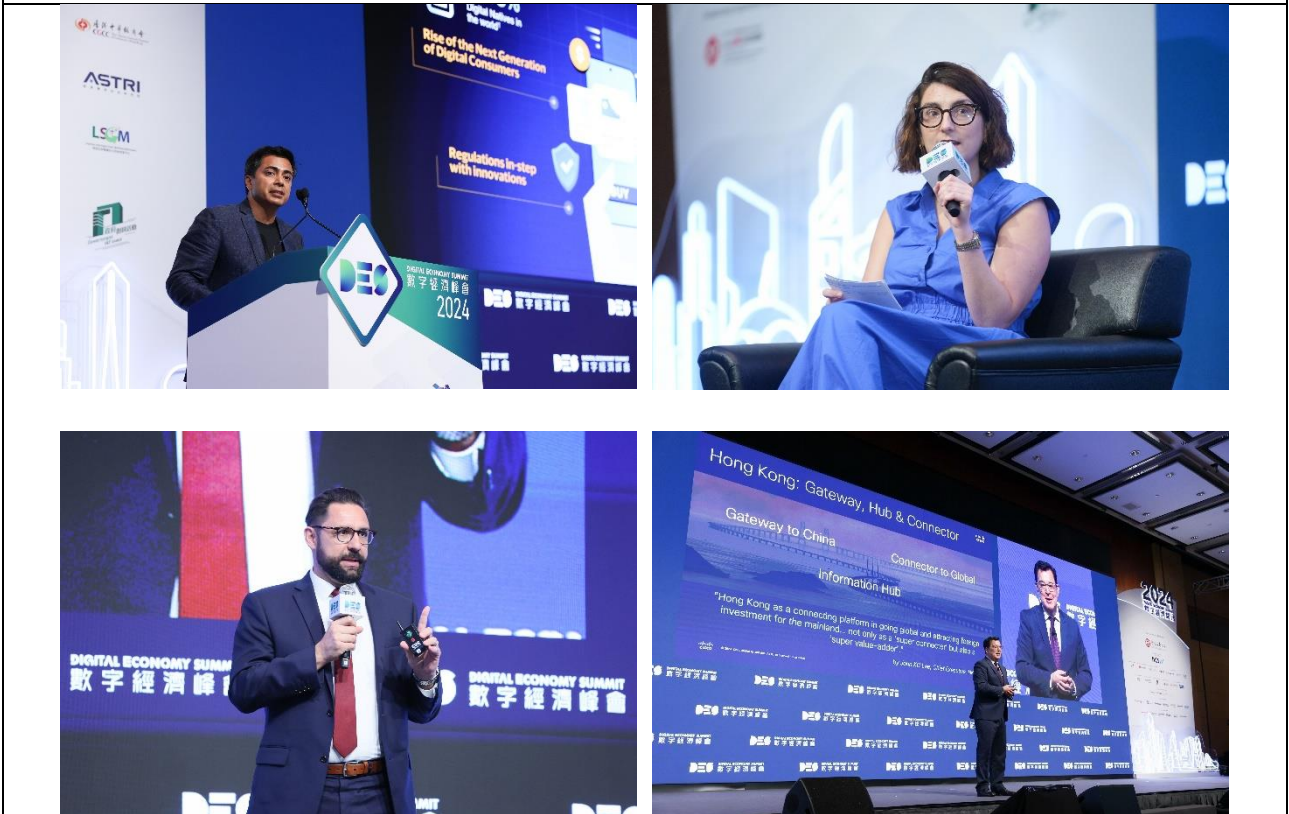
2024 数字经济峰会首日的主题演讲及专题讨论云集各地创科界翘楚、企业家、思想领袖及政策制定者。