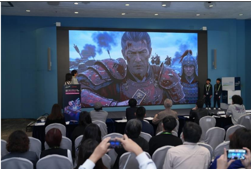
二等獎得主 JuicyAI Studio 隊伍及作品《神將·降世》