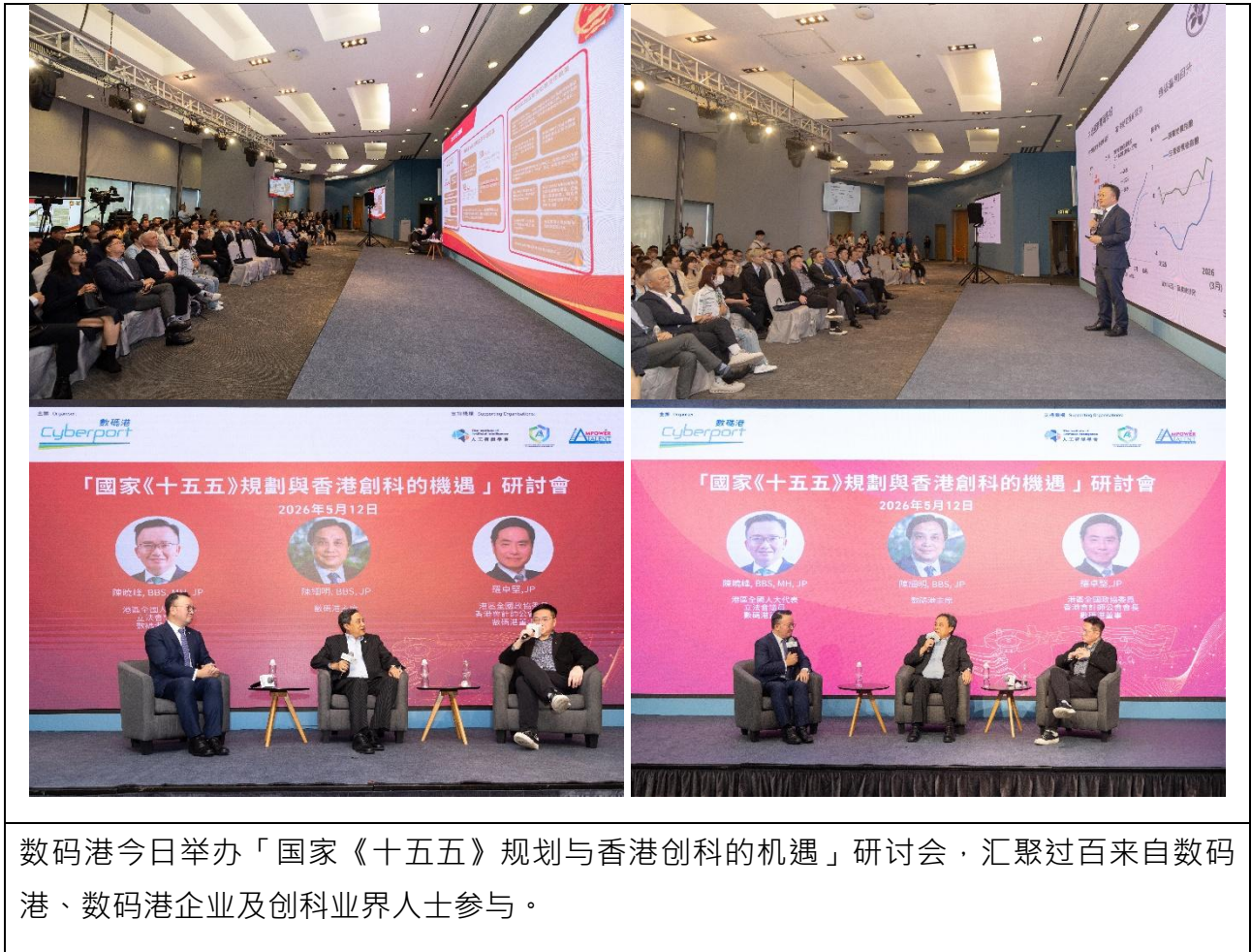
数码港今日举办「国家《十五五》规划与香港创科的机遇」研讨会，汇聚过百来自数码港、数码港企业及创科业界人士参与。